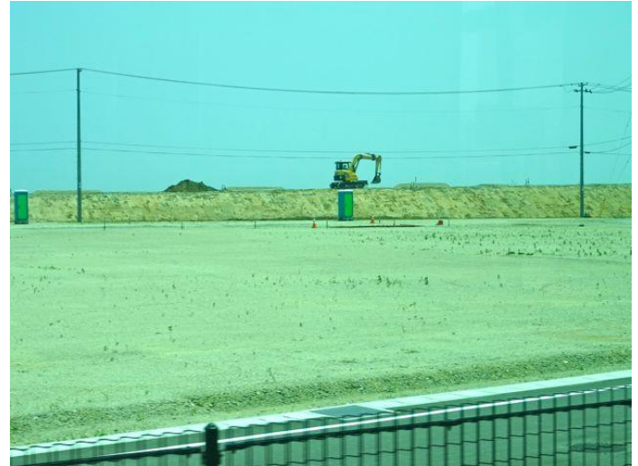
An der Küste wird der Damm gebaut.

sen nur Unkräuter, und ich habe niemanden gesehen, der dort gearbeitet hat. Lebenszeichen konnte ich nur an der Küste und auf der Straße wahrnehmen. An der Küste wird mit Baggern für den Damm-