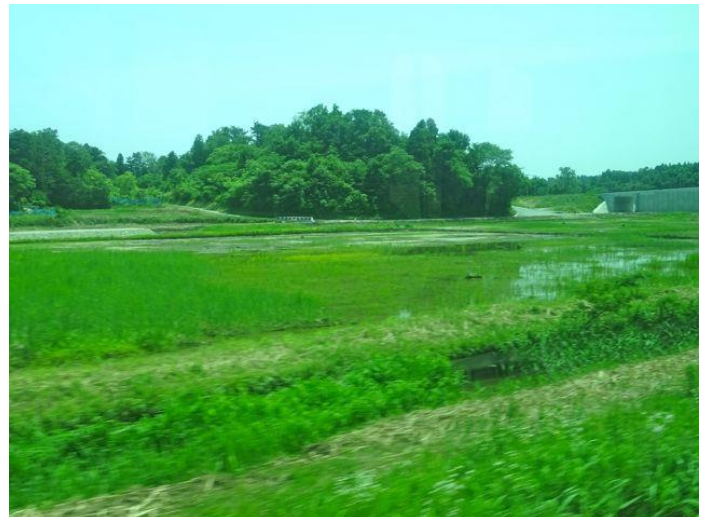
Vom Zugfenster aus sieht man nur Unkräuter im Reisfeld

Ich bin zuerst von Fukushima nach Sendai gefahren und dort in die Joban-Linie umgestiegen. Am Anfang fand ich, dass alles so normal aussieht, aber je südlicher ich gefahren kam, desto verwüsteter sah es aus beim Blick aus dem Zugfenster. Ich bemerkte ferner, dass die Strecke teilweise erneuert worden war. Eine Teilstrecke durch Reisfelder wurde wegen Tsunami-Gefahr mittels einer Brücke etwas höher gelegt. Es gibt auch neu gebaute Bahnhöfe. Die neu gebaute Strecke soll erst seit Dezember 2016 befahrbar sein. In den Reisfeldern wach-